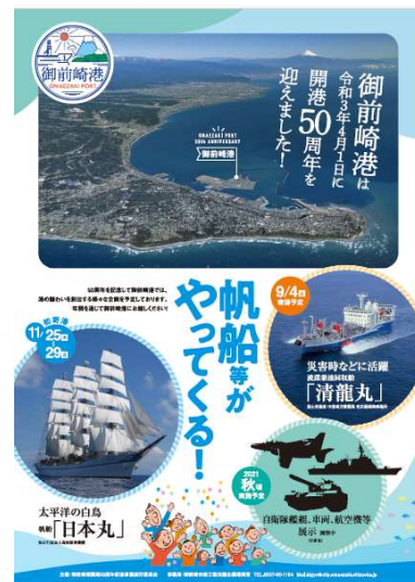
開港50周年周知ポスター