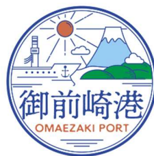
御前崎港ロゴマーク

新型コロナ感染対策に万全を期して実施したいと考えておりますので、是非とも御前崎港にお越しください。