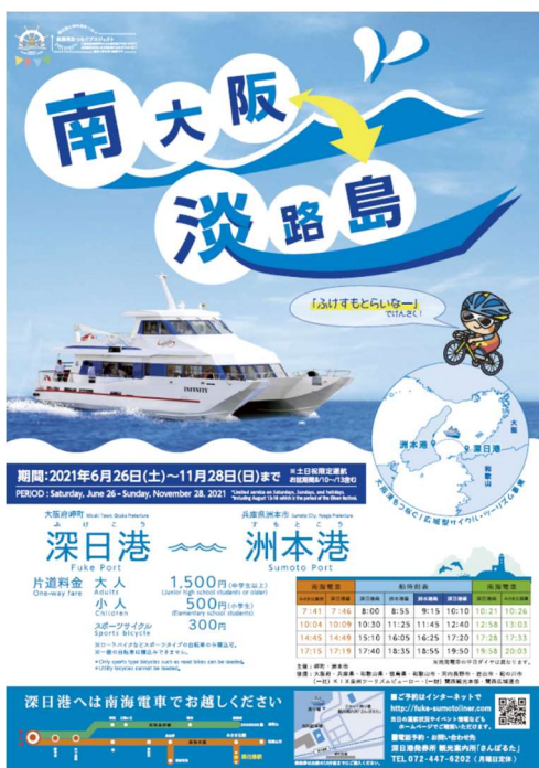
(参考)令和3年度運航ポスター

令和3年3月25日(木)に開催した第6回協議会では、令和3年度の取組みや今後の関係者間の連携について意見交換を行いました。令和3年度も引き続きコロナ禍にあり、今後も見通しは不透明ではありますが、運航が再開された暁にはコロナ禍で疲れた心身のリフレッシュのため、是非ともご利用いただければと思います。