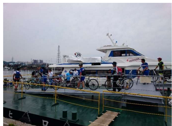
サイクリストの方々の乗船の様子